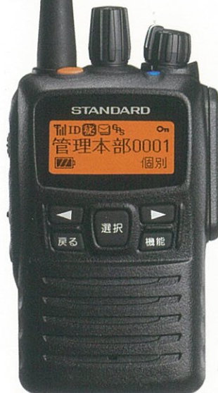
標準構成品: 本体、アンテナ、ベルトクリップ 技術基準適合証明取得機種