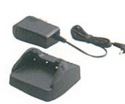
VAC-50A*2 急速充電器 標準型充電電池を約160分で充電