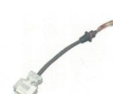
CT-147 データ通信ケーブル データ通信を行うときに使用。 ミニD-Sub15ピンコネクタに対応