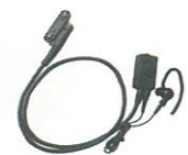
EK-505W タイプピンマイク&イヤホン 手袋装着でも操作しやすい