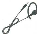
ME101/100CM EA-581用イヤホン EA-581に接続。ケーブル長100cm