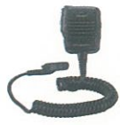
MH-66A7A 防水スピーカーマイク 防曇構造 3.5Φイヤホンジャック付