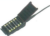
FBA-34*1 アルカリ単3乾電池ケース (防水) 乾電池 6 本使用