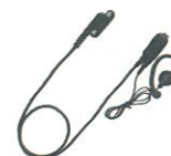
EK-313-581 小型タイプピンマイク&イヤホン イヤホンは脱落防止の耳かけ式