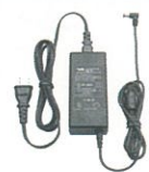
PA-47A 連結型充電器用ACアダプタ