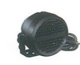
MLS-200 防水仕様 高出力外部スピーカー 防塵・防水性はIP55相当