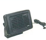
MLS-100 高出力外部スピーカー 騒音下でも音声聞き取りやすい 外部スピーカー