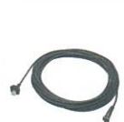
CT-146 マイク延長ケーブル ストレートコードで ケーブル長約10m