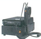
FP-33 指令局用直流安定化電源 デスクトップで指令局として 使用する際の電源装置。 大型スピーカー内蔵