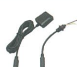
FGPS-3KIT GPSレシーバーキット GPS衛星からの電波を受信する レシーバーと本体を 接続するための接続ケーブル