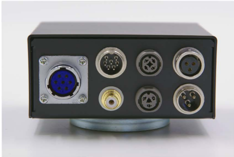
中継ボックス(裏面)