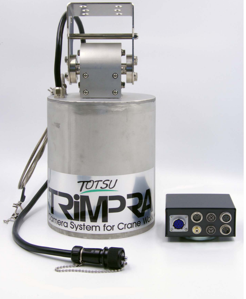
本体および中継ボックス