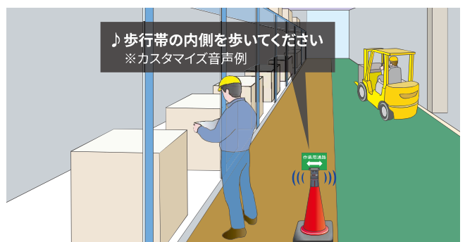
人車分離の安全対策(オプションのコーンアタッチメントとサインPOPを使用)