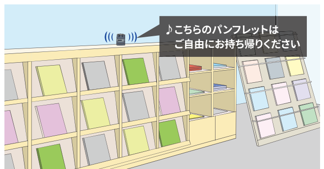
カタログ置き場のメッセージ