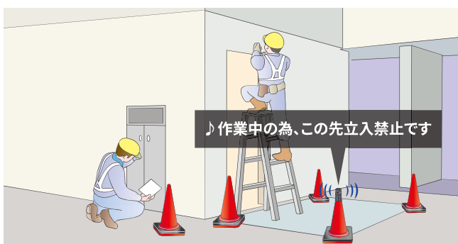
作業現場の注意喚起(オプションのコーンアタッチメントを使用)