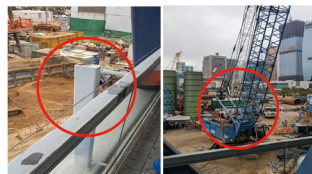
建物と重機の衝突防止