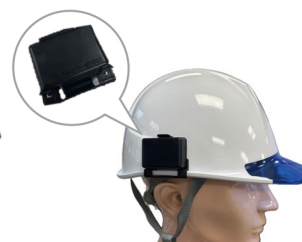
ヘルメット取付イメージ