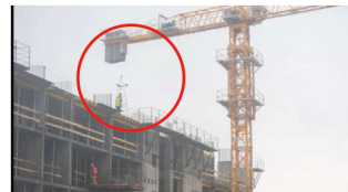
高所からの転落防止