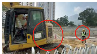
重機と作業員の衝突防止