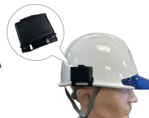
ヘルメット取付イメージ