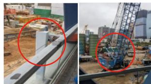
建物と重機の衝突防止