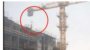
高所からの転落防止