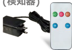
ACアダプター 音量調整リモコン