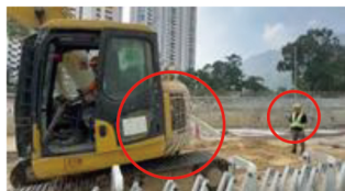
重機と作業員の衝突防止